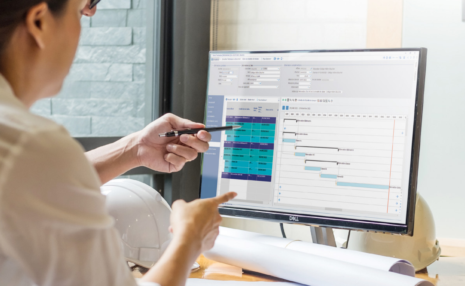
Depuis le devis d'exécution, planifiez les différentes tâches du chantier.